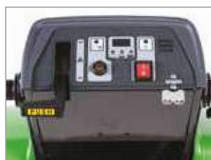
PANEL DE CONTROL INTUITIVO