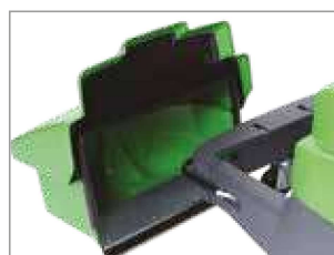
BANDEJA DE RESIDUOS DELANTERA GRANDE