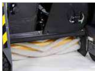
CEPILLO PRINCIPAL CON CERDAS EN FORMA DE V