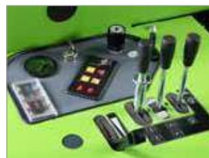
MANDOS ROBUSTOS E INTUITIVOS